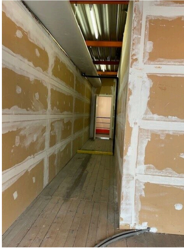
Local archives au 1er étage