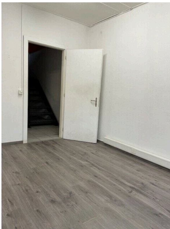
Bureau au rez