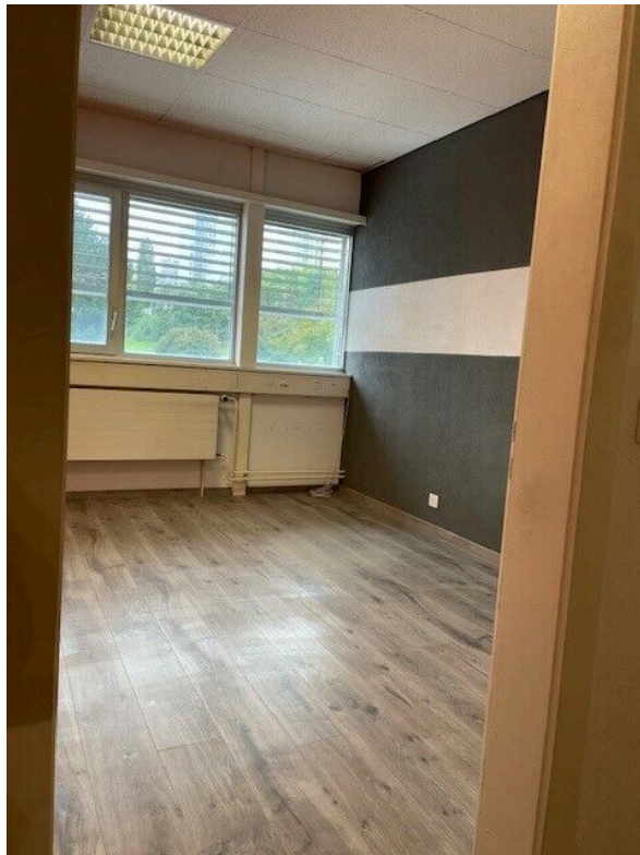
Bureau 1er étage